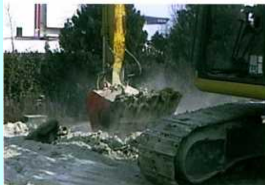
ドライブミキシング作業現場

高含水汚泥処理(ヘドロ処理)、残土処理、固化剤、セメント等を始めとした土質改良剤などの均等な混合作業、かく拌作業など…。作業用途にあわせて幅広いラインアップの中からお選びください。ドライブミキシングでは、コンパクト設計の回転ドラム部とフルバケット形状により、大容量の掘削・混合作業を高速に処理します。油圧モーターのシンプル構造、交換型駆動爪でメンテナンスが非常に簡単です。また、フローコントロールバルブを内蔵し、さまざまな形式の油圧ショベル(1ポンプ仕様及び2ポンプ仕様など)でも、つねに安定した作業(回転)性能を発揮することができます。もちろん、アダプターボス対応によりあらゆる機種に取付が可能です。